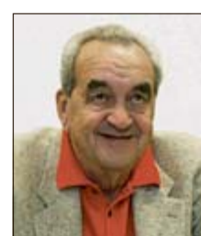
Il giornalista Bruno Pizzul